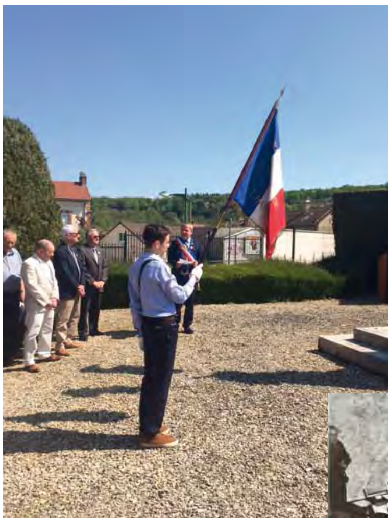
Champillon, le 8 Mai 2016